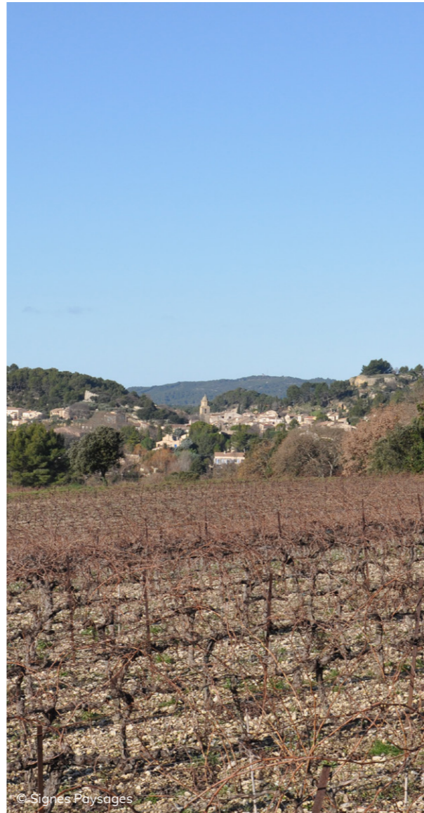
© Signes Paysages Le vignoble de l'AOP Coteaux d'Aix-en-Provence à Rognes