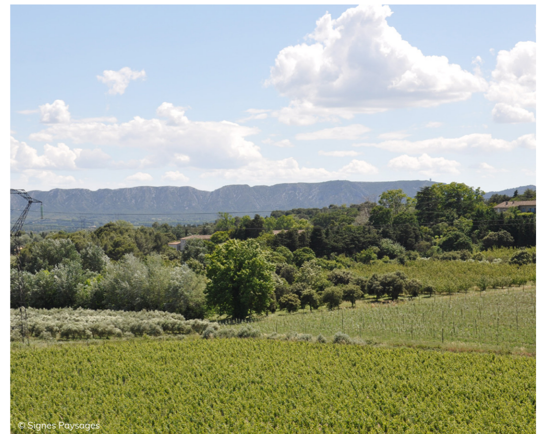
La vigne dans un système de polyculture