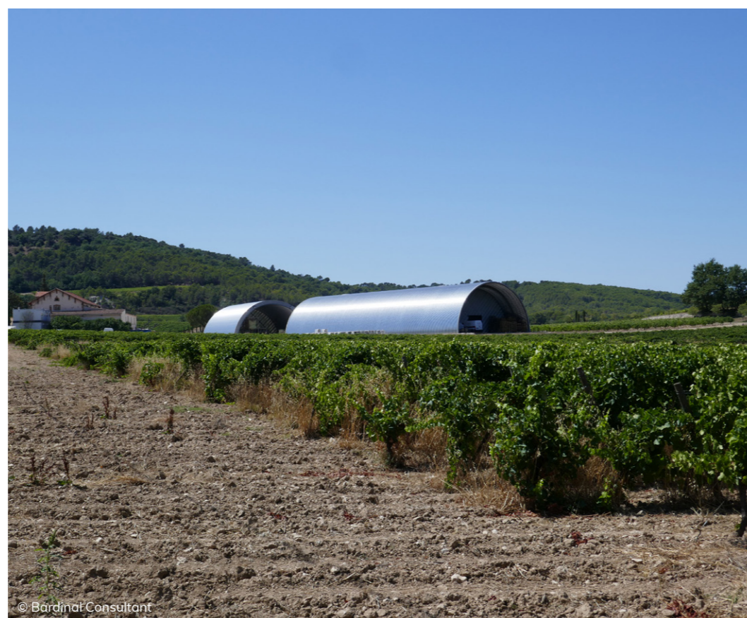
La mise en scène du vignoble - Château La Coste et ses chaix à l'architecture contemporaine signés par Jean Nouvel