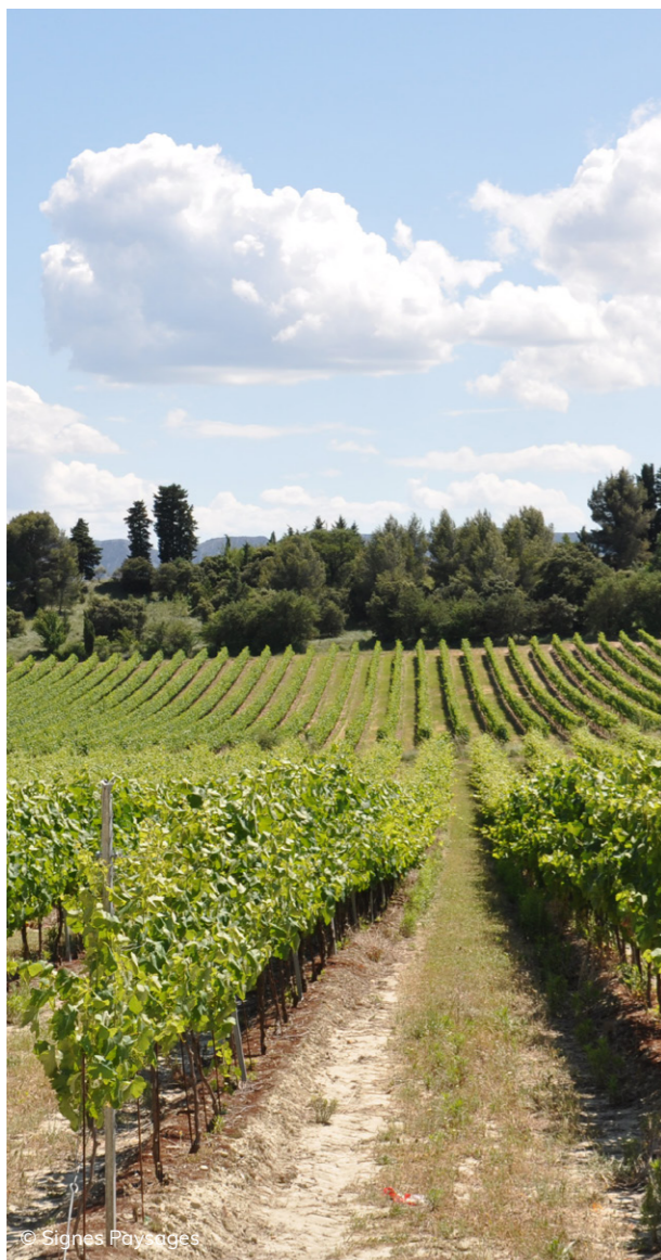
La vigne, une culture qui anime le paysage agricole.