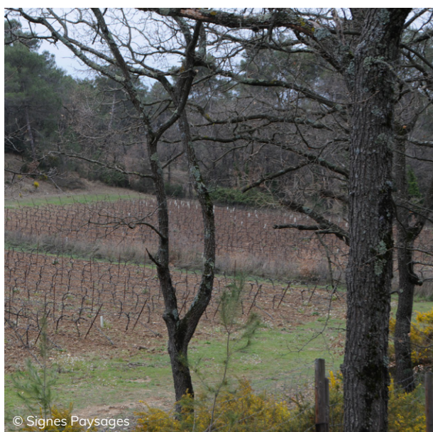
Le vignoble, espace de respiration en milieu fermé