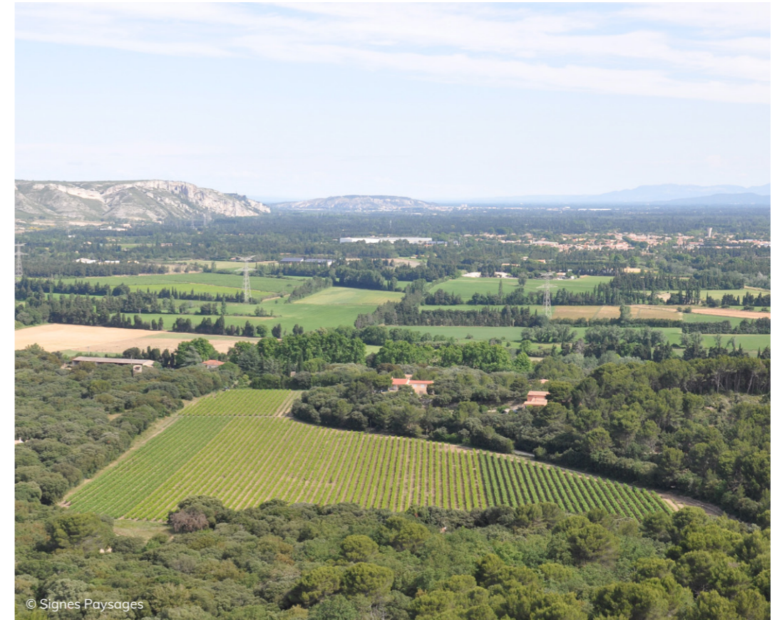
Vignoble dans la plaine de Sénas au pied des Alpilles