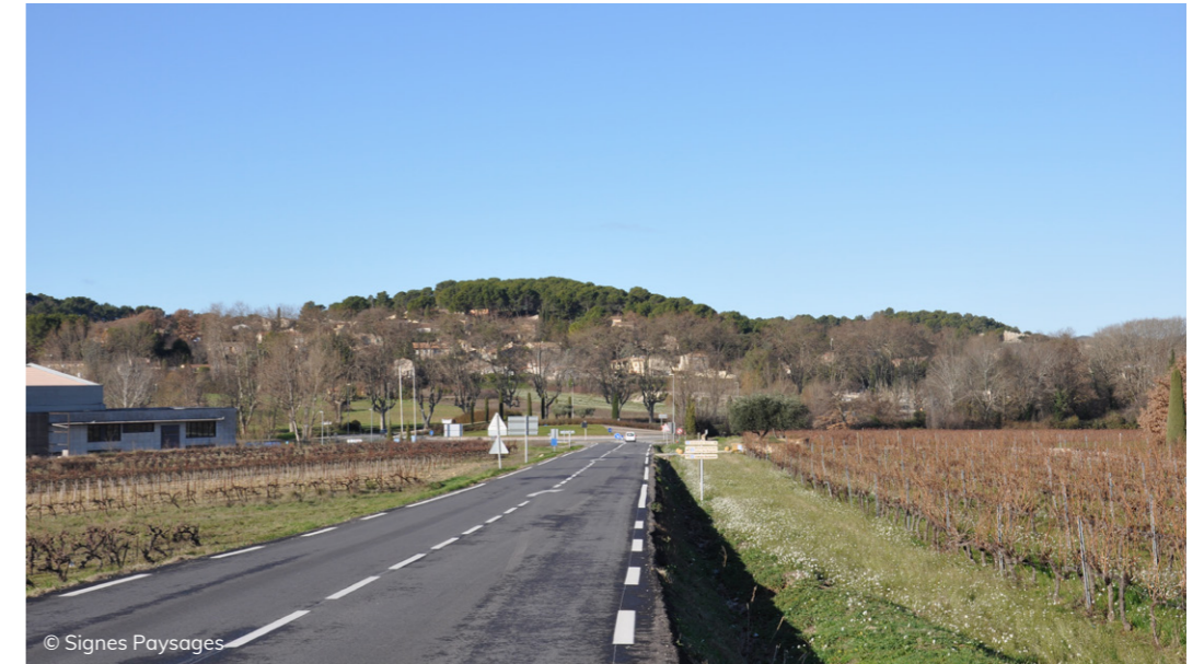
Les vignes accompagnent la RD15 et l'arrivée sur le village de Rognes