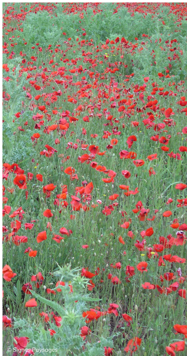
Le coquelicot, une messicole en régression.