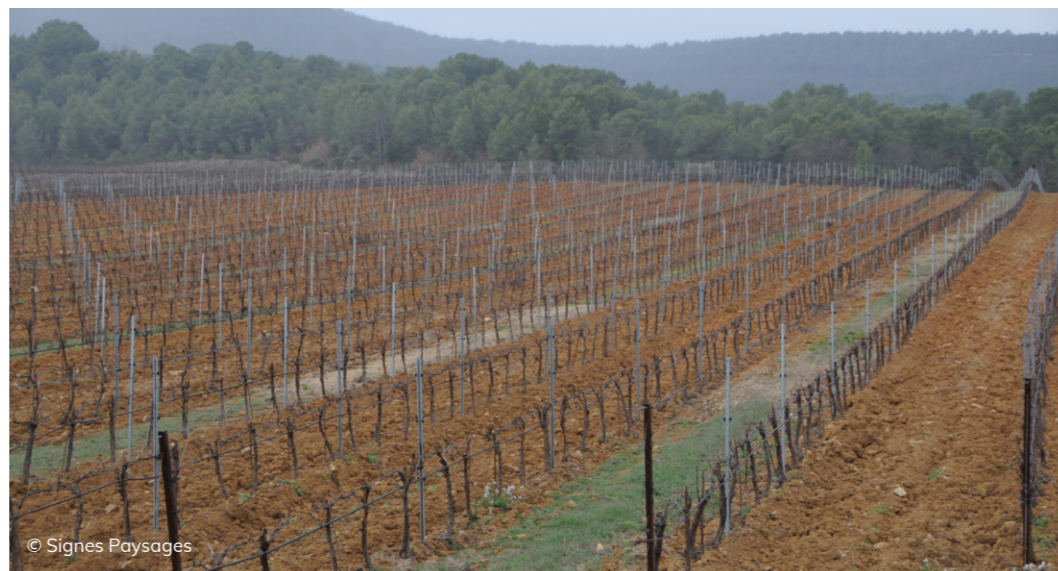
Les vignes du domaine de Château-Paradis. Rigueur de l'alignement jusqu'en limite de la forêt.