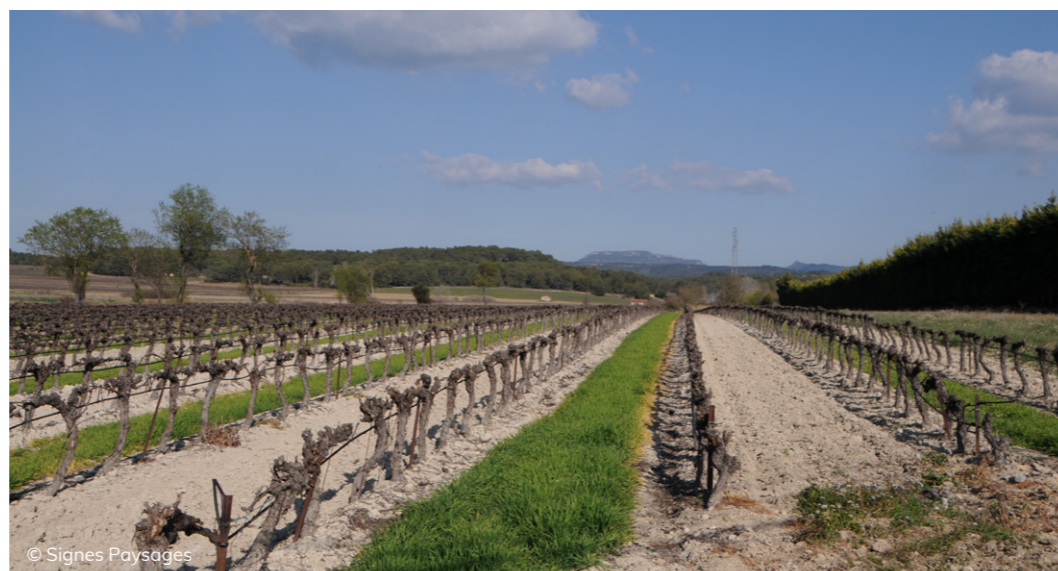
Les effets du changement climatique : goutte à goutte pour une culture qui se contentait de l'eau de pluie.