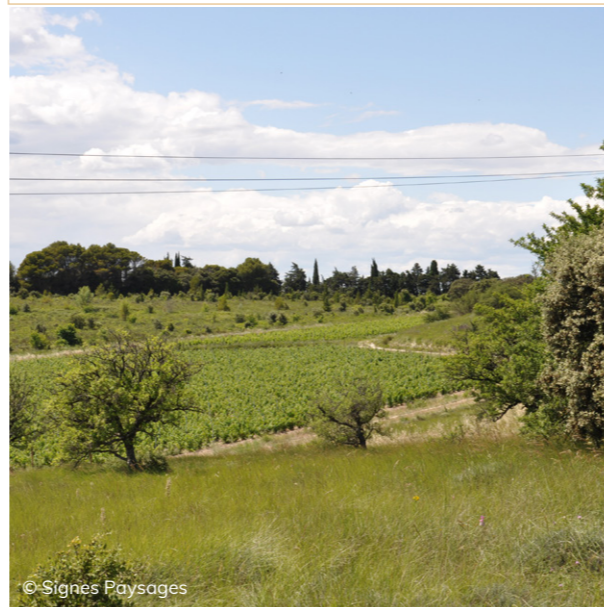
La taille et la conduite de la vigne participent grandement au paysage de la viticulture.