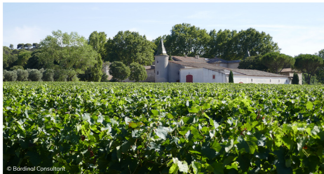
Château Bas dans la plaine de Cazan