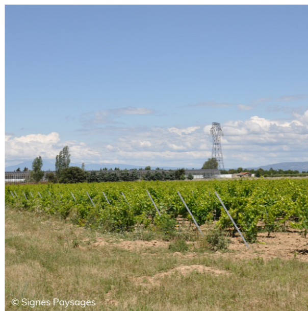
Vignoble en plaine - Arrière plan : serres et réseau THT