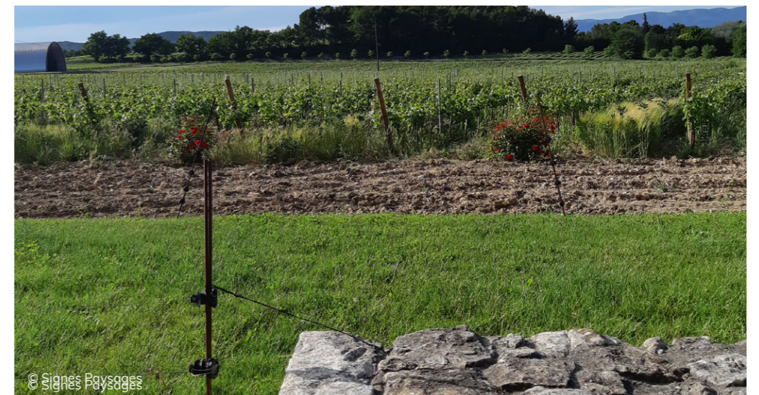
La protection du vignoble contre les ravageurs et plus. Ici la clôture est surmonté d'un barbelé.