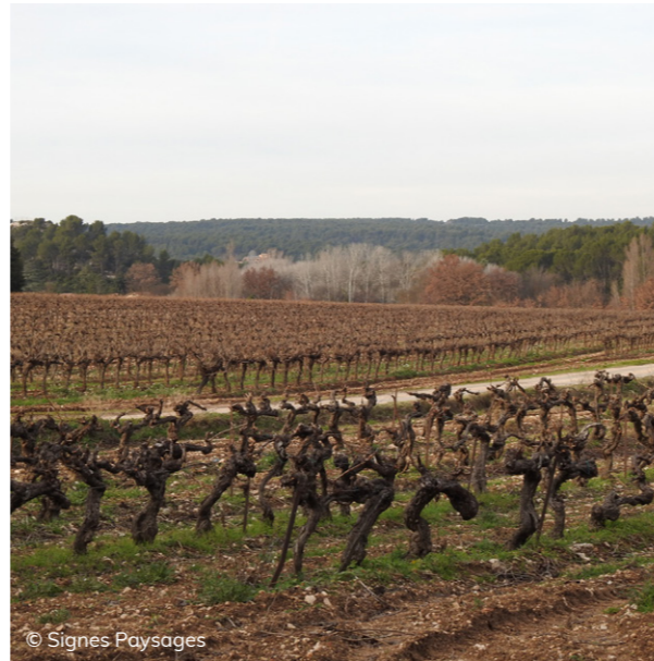
Les vignes aménagent des respirations dans les vallons boisés

Cette culture installe des paysages architecturés et facilement identifiables au sein d'unités paysagères différentes.