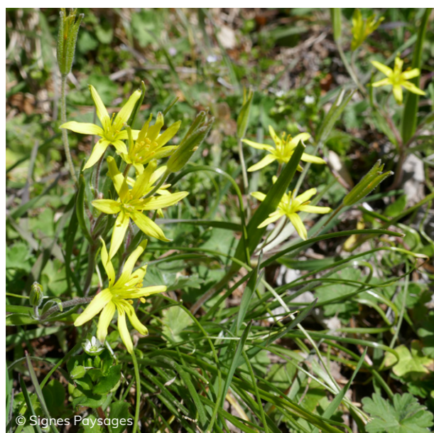
La gagée des champs, espèce protégée, apprécie le vignoble