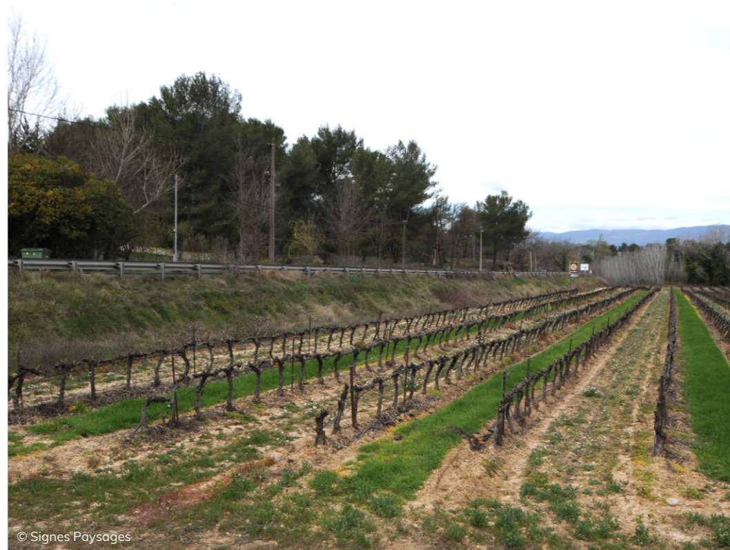
Culture sur des espaces résiduels entre RD556 et autoroute A51. AOC et AOP Coteaux d'Aix-en-Provence